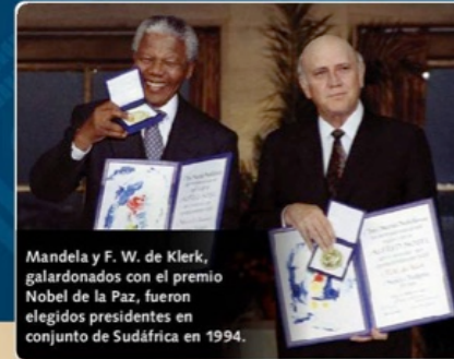
Mandela y F. W. de Klerk, galardonados con el premio Nobel de la Paz, fueron elegidos presidentes en conjunto de Sudáfrica en 1994.