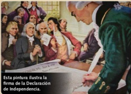
Esta pintura ilustra la firma de la Declaración de Independencia.

Sostenemos como evidentes por sí mismas dichas verdades: que todos los hombres son creados iguales; que son dotados por su creador de ciertos derechos inalienables [que se deben garantizar]; que entre estos están la vida, la libertad y la búsqueda de la felicidad; que para garantizar estos derechos se instituyen entre los hombres los gobiernos, que derivan sus poderes legítimos del consentimiento de los gobernados.